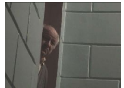
«Шампанское это себе возьмите»