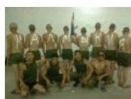
Калмыкия — сила!