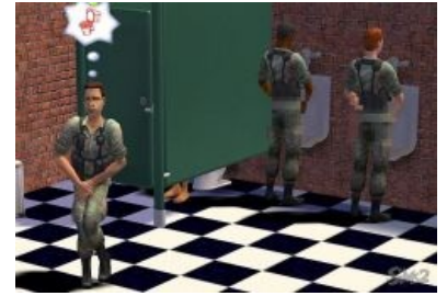
Даже в Sims 2 есть дедовщина

В США солдаты получают пизды много, часто и больно, но не от того, что пьяному дедушке стало скучно, а за конкретные проёбы. Впрочем, каждый отдельный случай сабжа у них расследуется, командира могут снять с позором, а семье павшего смертью «духа» выплатят компенсацию: у них с этим делом строго, так как завтра солдату может предстоить валить Бен-Ладенов и Саддамов. Более того, каждый случай у них разбирает военная полиция, плюющая на любой чин и сразу же рассматривающая любую жалобу и анально карающая офицера, в полку которого произошёл сабж статьи — лечение солдата будет идти за его счёт. Надо это сержантику? Нет. Впрочем, еще в 60-х армия в штатах была призывная, со всеми вытекающими, а особенно буйным цветом внеуставные отношения расцвели во время гоняния желтых человечков по джунглям , ибо общая атмосфера коррупции, распиздяйства и похуизма этому сильно способствовала (см. советский фильм «На прицеле Ваш мозг», там как раз будет показана дедовщина в армии США, да и вообще, сам фильм годно обличает говнокапитализм)