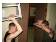
Посвящение в черпака