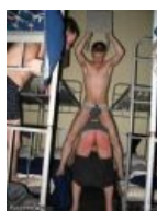
Учат быть настоящим мужиком