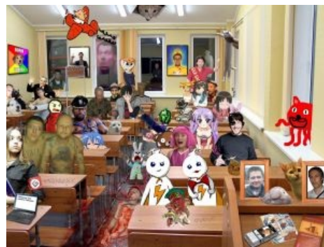
Мемы Двача в одном флаконе.