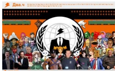
И ещё одна картина с мемами.