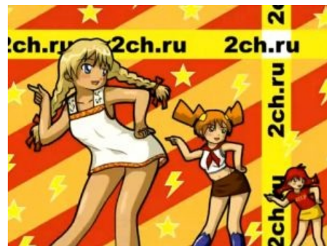
Некоторые из маскотов двача: Славя-тян , Двач-тян и СССР-тян .

Весь Двач, особенно /b/, часто использовал мемы из разных источников, как заимствованные с других имиджборд и IRC , так и «собственной разработки» или популярные в русском секторе интернета . Многие из них являлись картинкой с соответствующим текстом (так называемым макро ). Также были широко распространены специфические интернет-жаргонизмы ( L33t language , сленговые акронимы, кащеннизм ), умышленные опечатки и