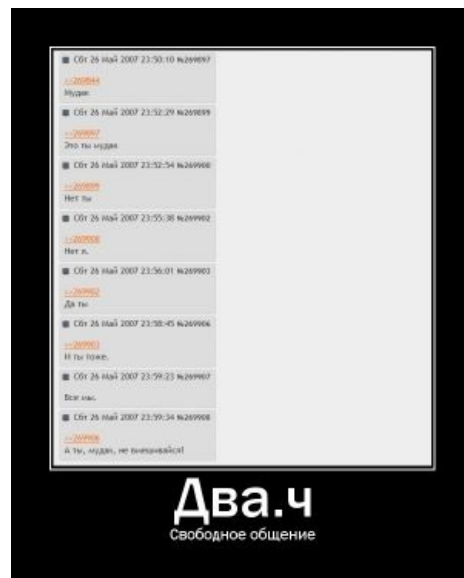
В /b/ каждый имеет право на свою точку зрения.