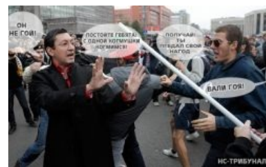
Палочка, замри! Битва экстрасенсов на ТНТ

Эдуард Багиров vs. Белов-Поткин. Троллинг в MinaevLive