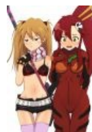
Кроссдрессинг Ёко и Аски