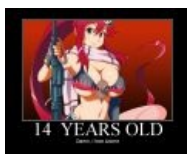
Ёко такая Ёко