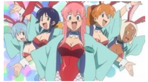
Рей, Махоро, Ноно, Аска и Ларк доставляют в шестом эпизоде