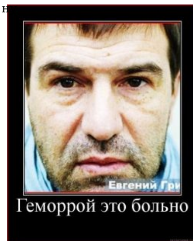
Небритый Гришковец небрит

Ходячий театр одного актёра, режиссёр, продюсер, певец ртом, литератор, недо-Вуди Аллен, Шариков лицом, автор множества спектаклей и монопостановок, рассказов, статей. Лауреат , бережно пересчитывает грамоты и медалки. Фантастически словопоносен, до такой степени, что это отметили даже в КВН . Страдает Наслаждается шизофазией . Ведет бложек, о закрытии которого с присущим пафосом объявил 17 февраля 2011. Написал последний по его заверениям пост. Копираст .