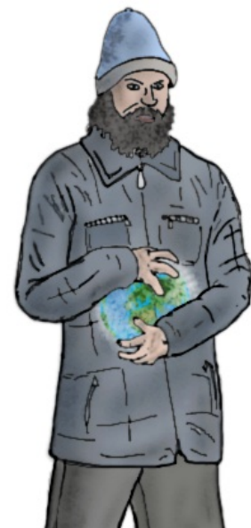
Перельман работы художник-куна

До лета 2014 года Перельман жил в Питере, в районе Купчино, в