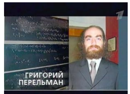
Фотожаба из зомбоящика