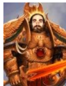
Перельман — истинный император Нульчана