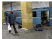
Перельману похуй на взрывы в метро