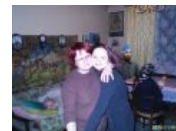
Sisters of Doom