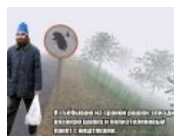
I sebyvayu of scappy Raschke, knit cap and spizdiv plastic bag with nishtyak