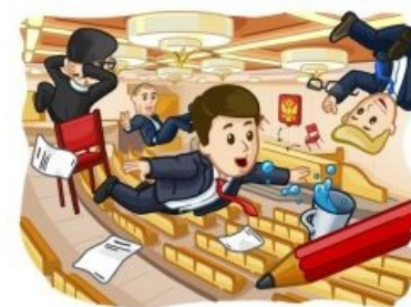
Российский парламент после отмены закона Всемирного тяготения