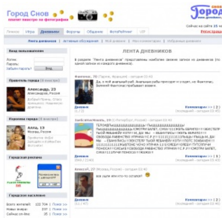
Рейд прошел успешно.

Не обделен вниманием сайт и гламурными девочками, они всегда готовы указать юному и наивному, что он долбоёб а она... ну вы поняли. Для них специально запилена возможность менять дизайн страницы и