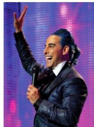
Trolling must go on!

Так как подростки , читавшие «Игры», склонны к максимализму, то хуёвенькая и бессмысленная, с их точки зрения, концовка всей трилогии их категорически не устраивает — ни тебе эпичного финал-баттла, ни розового хэппи-энда или хотя бы сурового экстерминатуса , а только совершенно развалившаяся дёрганая ГГ с бредовыми идеями, которая отправляется туда, куда ей и место — в свои родные ебень варить суп на кухне. В итоге даже внутри фэндомы соотношение мнений « Финал годный/Финал слит » составляет примерно 50/50, что даёт годную почву для срачей.