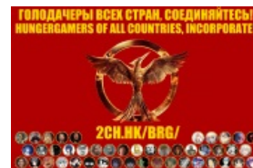
Актуальная на данный момент картинка из шапки тредов.

На форчане поголодать тоже любят, но по сравнению с сосачерскими, их игры унылы (ивенты модифицированы таким образом, чтобы персонажи няшились друг с другом и аутировали по 20 дней), а треды ещё больше напоминают чятик .