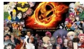
Некоторые старые игроки.