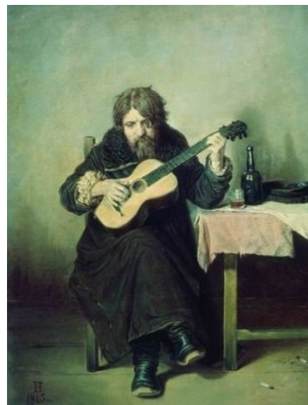
Василий Григорьевич Перов. Гитарист-бобыль

За занятиями на инструменте (о курении мануалов и речи нет) гитараст проводит в самом лучшем случае 25% того времени, что тратит на чтение этой статьи, разглядывание дорогих гитарок в интернете , пустую болтовню на форумах, мечты о том, что будет, когда в его руки попадут-таки настоящие «американский гипсан» и «ламповый маршал». Also, практически всё вышеизложенное относится к юным любителям электрогитары. С