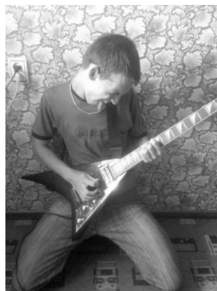
Ковёр на фоне гитараста

Гитараст же считает, что долгое сидение на одном месте, упырившись в книгу (и уж тем более в компьютер) является задротством чуть более чем полностью, поэтому недостаточно прокачанные скиллы он с лихвой компенсирует внешним пафосом и ЧСВ. Общее отсутствие элементарной музыкальной культуры , а также стремления совершенствовать свои познания в теории музыки, специфики формирования гитарного звука, нежелание выучивать основные гаммы приводит к тому, что сферический гитараст в вакууме умеет играть только квинтами (причем играет их в произвольном порядке), либо стандартными интервалами в секунду/терцию, ежели требуется какая-то «мелодия». Ну, а самые ленивые тру-гитарасты настраивают свою гитару в строй Drop D, чтобы самые низкие квинты зажимать одним пальцем, что сокращает срок обучения гитаразму в разы. Этот строй, кстати, работает как хороший детектор: тот, у кого осталось хоть чуть-чуть мозгов, поймёт, что строй такой нужен либо если нижних квинт в композиции много и чередуются они быстро, либо для получения другого звучания стандартной аппликатуры, либо для нестандартных приёмов игры, например, слайдом. Гитараст же только в таком строе и существует, если хоть раз попробовал. Таким вот образом соединение хаотично играемых квинт с трехнотной мелодией заставляет быдло орать «тру-мясо» и «Мы металлисты, сделаны из стали и огня...», небыдло — срать кирпичами, а у гитаристов возбуждает желание взять и уебать .