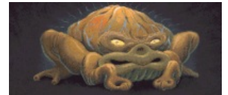
Dnyarri из Star Control 2

Алсо в винрарной игре начала девяностых « Star Control 2 » была раса Dnyarri — мерзко выглядящих жаб с огромными телепатическими способностями. К началу игры была выпилена их рабами Ur-Quan известным способом и даунгрейджена ими до Talking Pet — неразумного жЫвотного — средства беспроводной связи с оказавшимися поблизости космическими кораблями. Очень похожа.