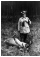
Особенности имперской охоты