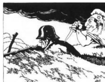
Мнение Гитлера (и не только)