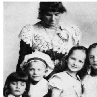
В детстве-то они все няшки

У сабжа началось заражение, боли не давали даже прямо сидеть на толчке, и ему в больнице кололи морфий по два раза в день ( стр. 80 ). Геринг всё-таки выжил. Но подсел на иглу.