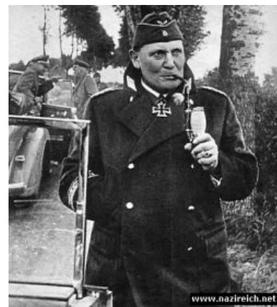
Геринг с бонгом фарфоровой баварской трубкой

— Мануэль Маруланда В. «Политик. Человек. Мужчина. Адольф Гитлер»