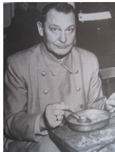
Я похудел на 30 кг! Просто я каждый день ел...

Творчество по теме, орфография цинично сохранена: