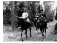
Канальи кардинала фюрера