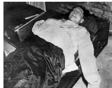
Рейхсмаршалов не вешают © Герман Геринг

Яд избавит от позора и страдания, И наутро весь узнает мир Что под сводами тюремной камеры Герман Геринг принял цианид.