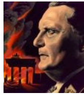
Геринг на фоне горящих Бранденбургских ворот