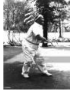
Здоровый образ жизни