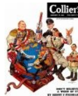
Наш герой (крайний слева) с коллегами на заседании