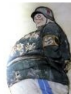
Он же по версии Букрыниксов