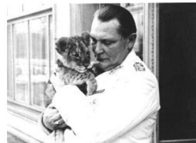
Геринг и его львёнок