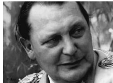
Я хоть и толстый, но тролль

— Франсуа Керсоди «Герман Геринг. Второй человек Третьего рейха»