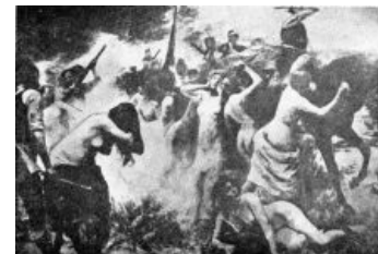
Работа неизвестного графика

В 1909 году тамошнего султана ушли и сослали КЕМ . Государство (де-юре, но не де-факто) вроде как отменило средневековую архаику вроде притеснений по религиозному признаку, по поводу чего торадиционалисты немного подвзбурлили и, в качестве недовольства, опять-таки выпиливали армян. Однако беспокоиться озабоченным национальным вопросом было не о чем: к власти пришли — сюрприз-сюрприз! — те самые лейберальные «младотурки», которые сей вопрос и форсировали. Получив бразды правления бедной страной с малообразованным населением, которое нужно было пинками загнать в светлое европеизированное будущее (а не туда , куда такие страны обычно имеют свойство скатываться), реформаторы начали думать о национальной идее, так как старую, за негодностью, благополучно списали на свалку истории. И, как ни странно, быстро её придумали в духе Европы того времени. Таковой стал пантюркизм, чем-то напоминающий плохой пересказ идей некоего Шикльгрубера и Компании.