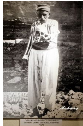
Старик-армянин с черепом родного сына в руках. Семеро членов его семьи погибли от рук турок. 1915 год

Методы же отдельно заслуживают упоминания. Поскольку мужчин, способных оказать сопротивление, осталось мало, а с теми, что остались, был разговор отдельный, со всеми остальными можно было делать что угодно. И таки делали, со всем присущим тому времени вообще и восточному менталитету в частности цинизмом . Например, путешествие пешочком, в темпе и с конным сопровождением. А по прибытии в точку назначения... путешествие обратно. Тоже пешочком и не сбавляя темпа, а кто сбавил — его проблемы, которые, как известно, конного шерифа конвоира не очень сильно интересуют. И так — пока путешественники не кончатся.