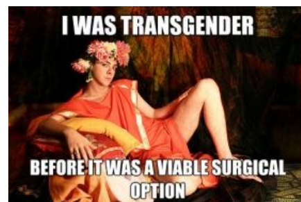
Гелиогабал был трансом прежде, чем изобрели

Эл(а)-Габал (чурк. Бог Горный) aka Вaal был сирийским богом света. Поэтому, а также из-за схожести его имени с именем бога Гелиоса, греки исказили Элагабал до Гелиогабал.