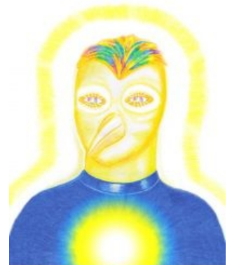
GORLOU Připravil a naplnil: Ivo Benda Připravil a naplnil: Ivo Benda Obr. 2500 www.ardela-evalek.cz www.vesmirmi-lide.cz