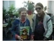
Так и закончилась «Страна Игр»