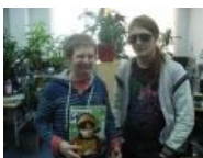
Так и закончилась «Страна Игр»