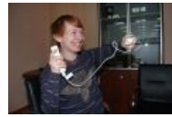
Wii Remote на фоне Константина Говоруна