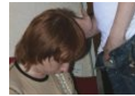
Врен в компрометирующей ситуации. Автор фото — Агент Купер . Орган — Анатолия Норенко.