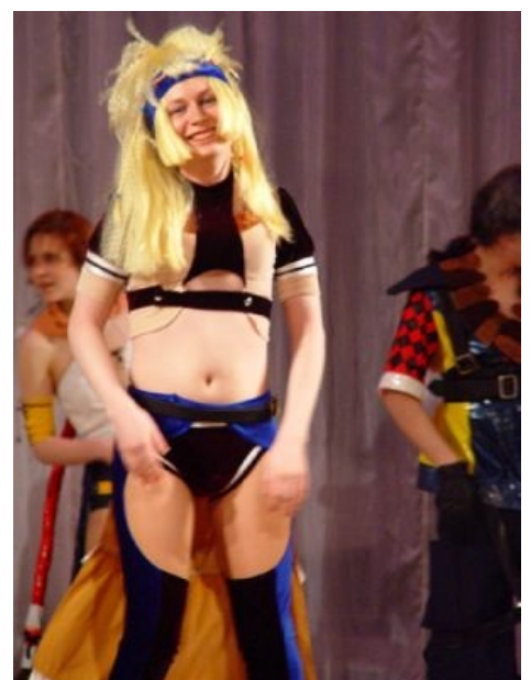
Врен косплеит Рикку

По политическим взглядам Врен является убежденным поцреотом , готовым круглосуточно отстаивать интересы родины , что не мешает ему смотреть на людей, не знающих английский, как на говно. На парламентских выборах голосовал за «Гражданскую Силу».