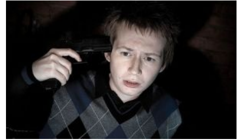
Врен хочет убить себя

«У меня такое ощущение, что в этом клипе Европа поет: