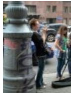
В очереди на премьере Mario Kart 8