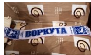
Сувенир для настоящих фанатов

С целью троллинга воркутинцы придумали и успешно зафорсили слоган «Воркута — столица мира!» Форсинг можно считать более чем удачным, так как лозунг известен даже обитателям уютенького.