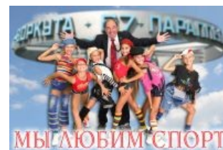
Бывший мэр Воркуты как бы говорит нам

Каждый год в Воркуте проводятся т. н. Заполярные Игры — серия различных соревнований, на которые под видом спортсменов съезжается самая отъявленная колхозная гопота и лютейшее быдло со всего севера России. В малолюдных деревнях, коими изобилуют северные окраины этой страны, не так много ночных клубов и кабаков, так что олимпиада служит отличным поводом для поездки в город. В итоге собственно соревнования не вызывают особого энтузиазма , и гораздо быстрее довольное быдло заполняет собой все доступные питейные заведения города, невозбранно достигая желаемого.