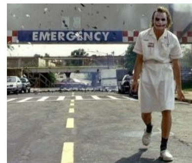
Голливудская версия супервиллайна в юбке

«Файерволл мне очень надоел, его больше не устанавливаю. »