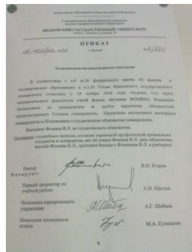
Приказ об отчислении