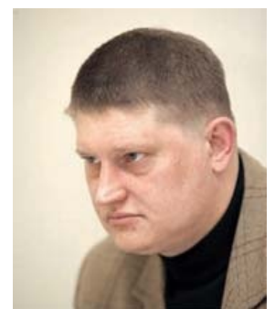
RedArc: будешь дружить, сука?!