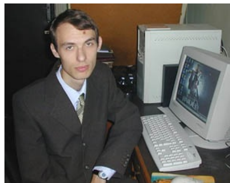
Duke/SMF: когда-то он был хакером, у-у-у... а теперь ссучился.

... В 2006 году назначен генеральным директором созданного при его участии ООО «Национальный центр по борьбе с преступлениями в сфере высоких технологий».