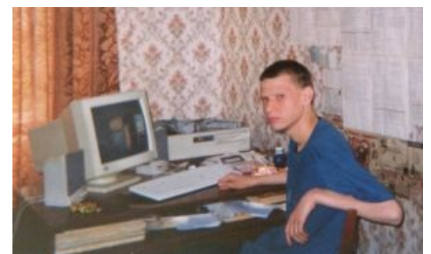
Сисоп 8BBS смотрит на тебя, как на говно!