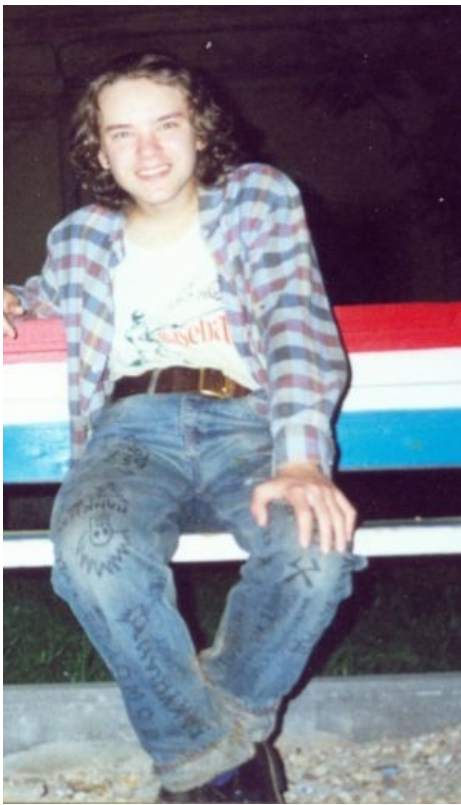
Товарищ Садист Not Yet A Hero

если тот начнёт стучать на коллег [2]). Но всё обошлось и так — Садиста признали невменяемым.