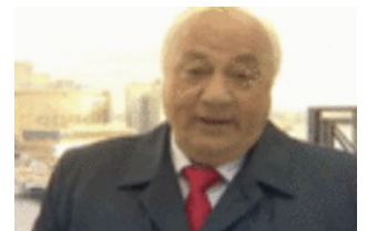
Колесо любит Путина.