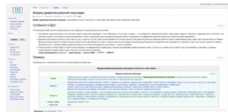
Типичная статья Викиреальности

Первый в истории альтернативный ВП вики-проект, который мог иметь иноязычные разделы: проходила худо-бедно работа над английским и « сибирским » разделами. Впрочем, «сибирский» раздел после нехилой драмы был закрыт, а английский чуть позже перенесён на отдельный хостинг, где выдолблен