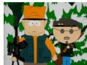
Джон Локк и Бенджамин Лайнус глазами конспирологов