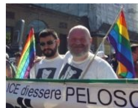
Бывшие участники Викиреальности ГСБ и Зукагой.

Джон Локк и Бенджамин Лайнус глазами конспирологов