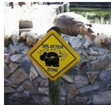
Наброс в природных условиях зоопарка.