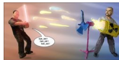
Наброс говна на вентилятор

Обозначение определённого преднамеренного действия , которое вызовет известные последствия (поднятие темы, бурление говн, кацапо/хохло/жидо/бульбосрача в соответствующих сообществах, риторические вопросы типа «А какой класс тут нагибает?» на форумах ММОРПГ или «А кто же таки победит в субботу, ЦСКА или Спартак?» на championat.ru , и т. д.) Короче, преднамеренная провокация холивара в любом сообществе, исключительно ради поддержания интеллектуального уровня общения с последующим (обязательным) съёмом из треда.