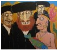
ЕРЖ и настоящий индеец