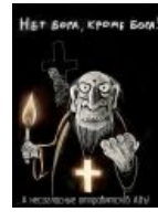
Нет бога, кроме Бога