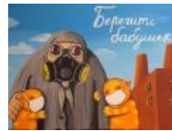
Ещё коронавирус Свидомиты