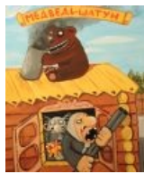
Я твой дом труба шатал