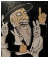
Дед Хасид и зайцы