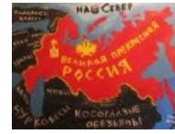
Эта страна (запрещено в России под страхом 282 статьи[1])