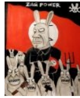
Зайцы и 14/88