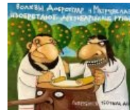
Подлинная история долбославия