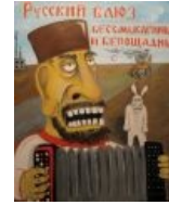
Бессмысленный и беспощадный