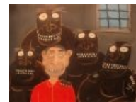
Тюрячка с ниграми