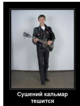
Сушений кальмар тешится.

Кальмар вже в м'ясорубці. Мені так трагічно і серце щемить. А тим часом суху вже нелюди в барі змітають плоть його вмить. Який висновок з цього впливає — ясно й родовитому пуделю білосніжному. Радій, радій, радій, радій, що ти не кальмар.