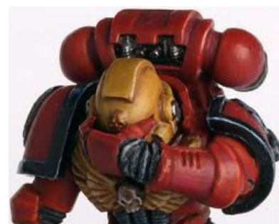
Адекватная реакция .

Dawn of War («ДоВ») — стратегия в реальном времени по мотивам Вархаммера 40k, хороша сама по себе, но печально знаменита привлечением в ряды вахафагов орды нубов и порождением пласта доверастов (изначально слово звучало как «довер», но быстро приобрело обидный подтекст). Доверасты вызывают лютую ненависть у истинных вахафагов незнанием и неуважением к бэку и настолке, глупыми вопросами («а по вахе уже и настолку сделали?») и всенепременно завышенным ЧСВ . В результате деятельности доверастов многие вахафаги начали презирать и сам ДоВ.