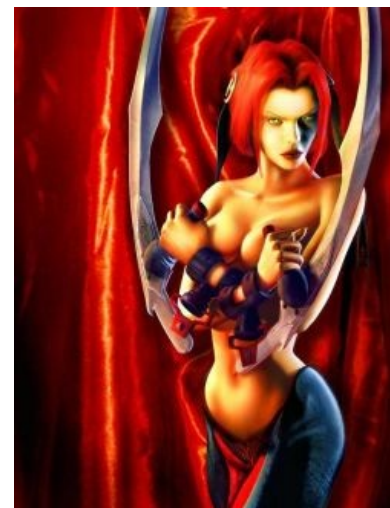
Вампиры фапабельны. Рейн гарантирует

все до последнего — машины адского нагиба, со стагами, более присущими существам раз в пять больше, все командуют армиями мертвецов, и на солнце горят лишь по ошибке, потому как умеют контролировать погоду и призывать черные тучи. И никакого моралофажества ВтМ или тем более блесок — графы вампиров злы до мозга костей, безжалостны и очень страшны. Вампирские рыцари крови (на лошадях-вампирах) считаются самыми опасными бойцами в мире ФБ вообще — а это мир, где существуют драконы и демоны размером с дом. Несмотря на это, вампиры два раза не смогли победить одну империю королевство обычных людей в далеком прошлом, и два раза — другую империю в «настоящем». В текущем конфликте «конца времен» кровопийцы внезапно не просто выступили на стороне Порядка против Хаоса, а стали его основной силой, и ставят перед собой цель навести в мире абсолютный порядок со всем живым населением превращенным в послушных и дисциплинированных скелетов... и судя по тому, куда движется эта история, у нежити есть все шансы таки победить.