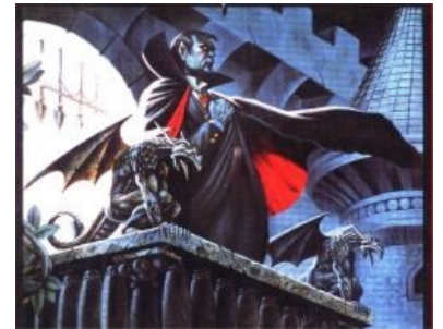
Сферический вампир в вакууме — Страд фон Зарович

Вампир (от англ. Vampire , также — вомпир , вурдалак и другие названия, тысячи их, древнеслав. — упырь , въпиръ и т. п.) — мифическое существо, питающееся человеческой кровью не только ради лулзов, но и для собственного выживания, а в 95% случаев также для возможности размножения. Вампиры являются объектом яростного шлика и фапа со стороны херок , готов и прочих неформалов .