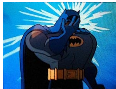
Бэтмен внимательно следит за этой статьёй

В Готэм-Сити — выдуманном мрачном, готичном «тёмном зеркале Нью-Йорка ниже 47-й авеню» с уровнем преступности over 9000, обитает столь же мрачный и готичный герой. Облачившись в стильный чёрный костюм летучей мыши , он бегаёт по ночным улицам города, вселяя ужас в сердца преступников, злодеев и просто случайных прохожих. И почти никто не догадывается, что на самом деле под суровой личиной Бэтмена скрывается Брюс Уэйн — беззаботный мажор, олигарх, меценат и плейбой. Что же, кроме необозримого количества денег и свободного времени, могло подвинуть Брюса на столь экстравагантное времяпрепровождение? Дело в том, что в детстве какой-то гопник напичкал свинцом родителей прямо на глазах у будущего Бэтмена. Но судьба была милостива к пацану, после трагедии он не стал маньяком-психопатом , а просто начал по ночам хладнокровно мстить Мировому Злу, напялив чудной прикид с плащом. Чтобы максимально эффективно и зрелищно творить справедливость в тёмных закоулках Готэма, до этого Брюс проводил годы в разных жопах мира, разучивая карате, кунг-фу, ниндзюцу, капозйру, самбо, бабсклей и другие труднопроизносимые слова. И, конечно, на ниве борьбы с преступностью Бэтмену здорово помогает его безобразно большое наследство, которое он щедро тратит на бесчисленные хитрожопые высокотехнологичные гаджеты на все случаи жизни, плотно утрамбованные в бездонные кармашки его пояса и в обязательном порядке снабжённые приставкой