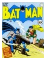
Бэтмен НИКОГДА не пользуется пистолетами, но вот пулемёты — это нормально!