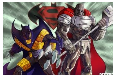
Заменители Бэтмена и Супермена в 90-х.

В 2015 писатели историй о Бэтсе признали очевидное: Бэтмен таки может стать Б-гом после опиздюливания Дарксайда. Что, в принципе, неудивительно, так как Бэтмен, хоть и человек, но всё же заставляет срать кирпичами все суперзлодейские альянсы и даже, казалось бы, дружественных супергероев-добрячков. Можно с уверенностью сказать, что Бэтмен раздаст пиздюлей абсолютно всем. Супермен знает, о чём речь.