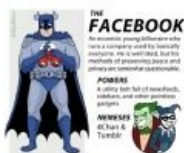
Если бы Бэтмен был интернет-сайтом...