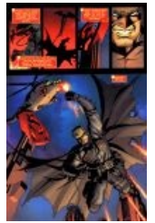
В Советской России...