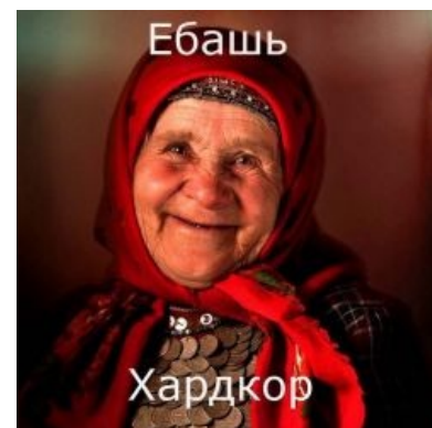
EUROVISION 2012 - RUSSIA - Бурановские Бабушки - Party For Everybody Камон энд дэнс

А бабушек тем временем штампанули на виниле . Пластинку подарили самим исполнительницам.