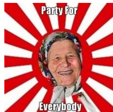
Форсед-солнышко от бурановских бабушек