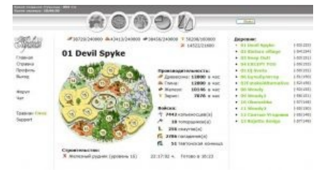
Родовое поместье губернатора 80-ого уровня