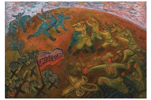
Братание глазами авангардистов

«Товарищ, я не хотел убивать тебя. Теперь только я вижу, что ты такой же человек, как и я. Прости меня, товарищ! Мы всегда слишком поздно прозреваем. Ах, если б нам почаще говорили, что вы такие же несчастные маленькие люди, как и мы, что вашим матерям так же страшно за своих сыновей, как и нашим, и что мы с вами одинаково боимся смерти, одинаково умираем и одинаково страдаем от боли! Прости меня, товарищ: как мог ты быть моим врагом? Если бы мы бросили наше оружие и сняли наши солдатские куртки, ты бы мог быть мне братом, — точно так же, как Кат и Альберт. Возьми от меня двадцать лет жизни, товарищ, и встань. Возьми больше, — я не знаю, что мне теперь с ней делать! »