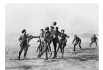
Матч Англия — Германия

— Примерно так говорил Ленин в эмиграции