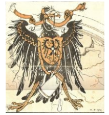
Злые немцы в представлении русских

Стоит отметить также ужасающую практику немецких офицеров по созданию универсального солдата, который не должен будет чувствовать к противнику никакой жалости. Для этого только что призванных на службу юнитов методически упражняли в жестокости к противнику , заставляя их истязать и замучивать до смерти пленных . Мотивировалось это тем, что хорошо сражаются только озверевшие солдаты. Естественно, после таких упражнений солдаты или сходили с ума, превращаясь в послушную машину для убийств, или становились убежденными пацифистами (правда, только до первого боя).