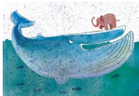
Главное преимущество кита — это масса

Встретиться комбатанты реально могут лишь на мелководье, ибо, находясь в привычных сферах обитания максимум, что могут себе позволить — закидать противника дешевыми понтами и мелкими угрозами. Следовательно, встреча произойдет на отмели, где у динамичного и ловкого слона явное преимущество. Исход боя довершит арсенал. Ведь у слона имеются мощные клыки, четыре колонноподобные ноги и остро отточенные бивни. Кит в состоянии предоставить в противовес только хвост, который хотя и обладает огромной разрушительной силой, способен двигаться лишь в ограниченном секторе. Исход битвы очевиден, и с вероятностью 92,34 процента побеждает слон.