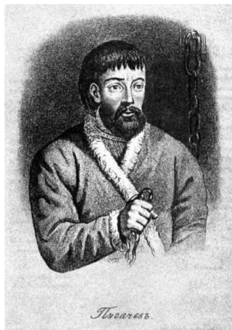
Емельян Пугачёв, бессмысленный и беспощадный