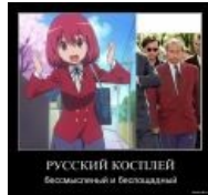
Моар русского косплея