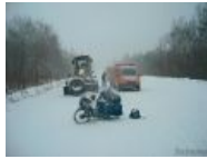
Русский мототуризм, бессмысленный и беспощадный