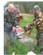
И так в стране делается всё