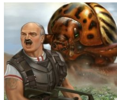
Битва за Урожай

Словооружие ft. Лишнее Население - Бус Друзья Пети-супермена о своей веселой жизни