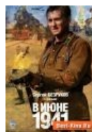
Тот самый советский Рэмбо