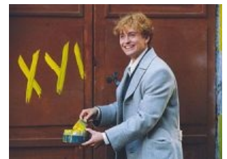
Истинный Есенин, гы

Однако Безрукову нужно было не это. План отца сработал: благодаря роли реального справедливого пацана , столь любимой в этой стране, он получил всенародную любовь, известность и узнаваемость, о чём говорит неслабое количество фан-сайтов и групп вконтакте . И теперь, будучи известным и узнаваемым, наконец-то мог сыграть Есенина! И наконец-то сыграл! И получилось фуффло ! Малолетки и умные люди не отрывались от экрана в дни премьерного показа. В этом фильме доставила только, разве что, финальная драка. Для пиара проекта папаша Безрукова написал графоманскую книжицу «Есенин», зачем-то поместив на обложку не портрет великого русского поэта, а портрет своего сынульки в кудрявом парике. Книгу сильно обосрали критики, мотивировав присутствием в книге всякой похабщины, и широкого резонанса она не вызвала.