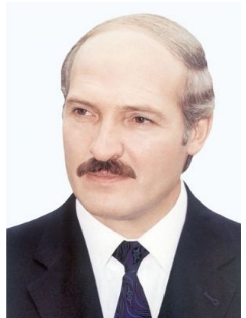
Куда уж без него

Бацька ака Александр Григорьевич Лукашенко — Первый Президент России Республики Беларусь , известный на рынке поставщик услуг главы государства. Неизменное КАЧЕСТВО с 1994 года. В качестве дополнительных опций ЖЭСТАЧАЙШЭ и совершенно бесплатно прилагаются ненаклоняемость, стабильность™, борьба с пятой колонной , социально-ориентированная рыночная экономика, низкие цены на нефть/газ от горячо любимого старшего брата , а также функция генератора случайных чисел эпичных цитат.