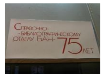
Отделы банятся надолго