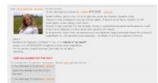
Редкий, но возможный на Нульчане случай