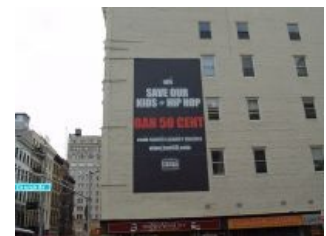
Предложение забанить нахуй 50 Cent (им же и пропиарено)