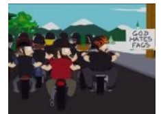
Южный Парк против байкеров.