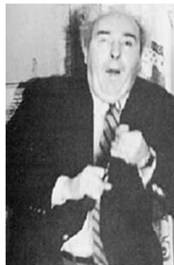
I did it for the lulz