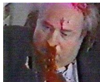
Весь такой загадочный