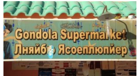
бНОПНЯ в реальности