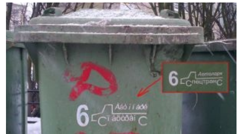
Родственник сабжа — кракозябра, воплощённая в реальность