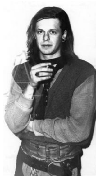
Шликабельный Боренька такой шликабельный