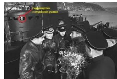
Торжественная встреча К-19

Уинстон Рандольфович высрал нехилую кучу кирпичей по данному поводу, вплоть до мысли: «А может, ну их нахуй, эти конвой?», но Коба пресёк на корню такие поползновения и пораженческие настроения, разведя его на «Будь мужиком, блеать!» . Рэндольфович напыжился, но согласился зарядить в этом сезоне ещё один конвой, как договаривались.