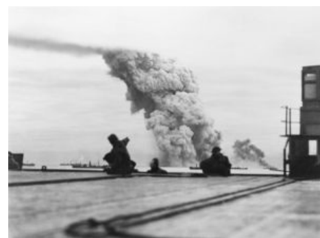
Кто-то в Мурманск не доехал. PQ-18

Слегка охуев от оглушительной проводки «конвой в ад», джентельмены стали чесать репы и думать, как теперь выполнять свои обязательства перед усатым игроком в красных трусах. Шизофазия в духе «ну их, эти конвой» возобладала, но была прервана Отцом, которого Художник имел под Сталинградом. Плюс, после сокрушительного поражения бриттов под Сингапуром, узкоплёночные япошки втыкались в карту Индийского океана и готовились отредактировать ее: перекрасить в собственные цвета Индию, Бирму и прочие милые кусочки британской империи. Плюс кровавые конвой на Мальту. Позвонев калькулятором и сложив 2 и 2, решили продолжать. 2 сентября конвой PQ-18 пошёл в Мурманск. Впервые в состав ближайшего эскорта, прямо в ордер конвоя, включили авианосец, кстати, только что построенный.