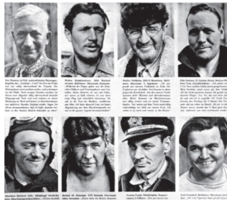
Им выдали сухие штаны