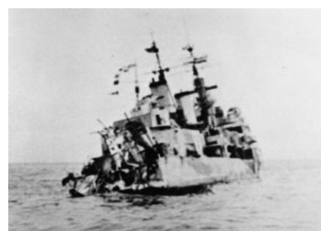
«Эдинбург» с повреждениями зада кормы и дырочкой в левом боку