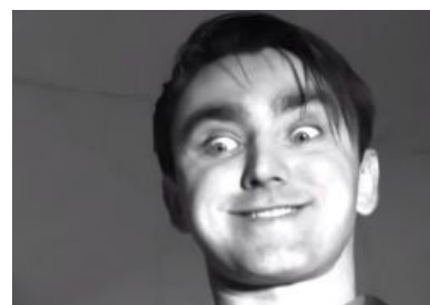
Ментовский Rape Face