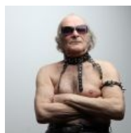
Чёрный Властелин афористики