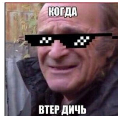
Deal with it

«Я — это театр одного актёра с массовой в виде человечества. »