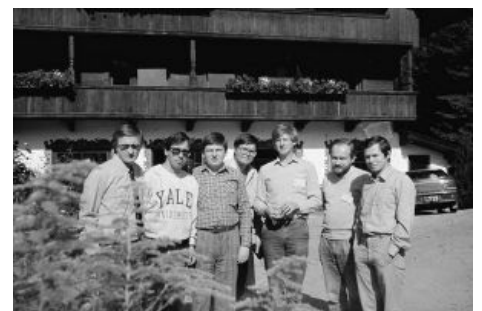
Глазьев, Улюкаев и какие-то люди в компании Чубайса. Австрия, 1991

Будущий либерал и реформатор вступил в стройные ряды КПСС в далеком 1980-м. По собственному признанию, ещё тогда Чубайса похищали инопланетяне завербовало ЦРУ, с целью разрушить экономику проклятого Совка , но в реальности тогдашний Чубайс — крестный сын Андропова, который по сути первым и начал перестроечные реформы в СССР. А конкретно — детище андроповского проекта «Звезда». После того, как в результате реформ СССР был полностью реформирован, Толик присягнул новому, заокеанскому сюзеру вместе с остальными участниками проекта, и в дальнейшем прославился на ниве реформирования уже Российской Федерации, что ему чуть было не удалось. На заре 90-х Чубайс — главный экономический советник мэра Ленинграда Анатолия Собчака, что кагбе говорит нам, почему он ещё на плаву.