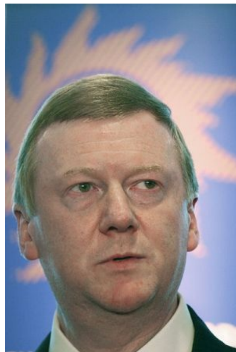
Анатолий Борисович сияет идеями

Кормушка только разрослась. Все сегодняшние госэнергокомпании (впрочем, как и все госкомпании) являются источником колоссальной коррупции и разворовывания бюджета. Тендеры сливаются левым фирмам, а если и достаётся что-то нормальным частным компаниям, то только с большими откатами (в среднем по больнице 30-50%, хотя в особо интересных случаях доходит до 80-90% ). Начальники департаментов и члены совета директоров часто являются ставленниками от разных «мафий» (алюминиевой, нефтяной и т. п.), что позволяет проводить профитабельные махинации в партнёрстве с другими крупными компаниями. В итоге почти любой тендер оборачивается разворовыванием бюджета, так как откаты просто закладываются в стоимость продукции частных фирм.