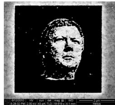
Табличка на памятник

Интересно, что Чубайс, занимая высокие посты, фактически распределяя государственную собственность, руководя гигантом РАО «ЕЭС» — похоже, не прихватил себе даже вшивого заводика, нефтяной вышки или гидроэлектростанции. Если погуглить, можно найти компании, скупившие образовавшиеся после расчленения РАО производства: 6 ОГК, 14 ТГК и энергосбытовые организации. ОАО «ФСК ЕЭС» (системообразующие ЛЭП) полностью принадлежит государству. Как и гидрогенерирующая компания ОАО «РусГидро», ну и АЭС никто никогда частникам не отдаст, ибо нехуй. Однако свято верующим в честность АБ настоятельно рекомендуется погуглить историю группы Е4 и прочий компромат на господина Абызова и Ко.