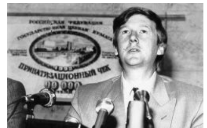
Чубайс на фоне ваучера

Звёздный час карьеры наступил в 1991 году, когда Чубайс стал министром и председателем Государственного комитета Российской Федерации по управлению государственным имуществом. А в 1991-м всё сколько-нибудь ценное имущество РСФСР (заводы, газеты, пароходы) находилось в государственной собственности. Под руководством Чубайса разработана программа приватизации, во время которой население этой страны оказалось надето на ваучер. В ходе ваучерной приватизации все имущество страны было оценено в смешную сумму в размере 1500 миллиардов рублей, на эту сумму были выпущены ваучеры, которые раздавались населению не на халяву, а за бабло. За каждый ваучер нужно было заплатить 25 рублей. Номинальная стоимость каждого ваучера составляла 10 тысяч (на ваучере было просто написано «10000», а чего десять тысяч — непонятно). Ваучеры не были именными, поэтому любой мог их купить или продать. Хитрые директора заводов и фабрик быстро смекнули, что если не платить рабочим зарплату, то рабочие будут вынуждены продать им свои ваучеры, чтобы не помереть с голоду. Так эти директора становились полноправными владельцами предприятий.