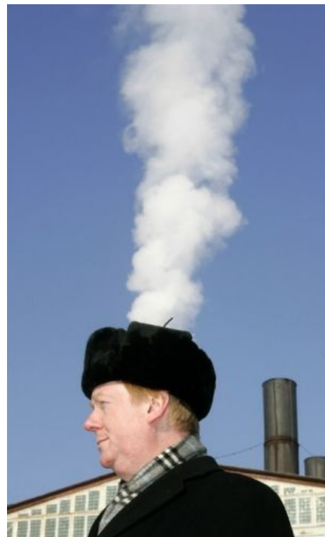
На воре и шапка горит

Смеуечка всей реформы столь примитивна, что доступна даже обезьяне. А именно, внимание, лозунг: монополизация естественной монополии РАО ЕЭС . Закон РФ «о естественных монополиях» определяет ЕМ как,