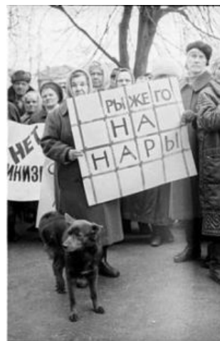
Признание в народе.

«Чубысь», однако, присутствует в книге «Язычество древних славян» Рыбакова, остальное было домыслено позже.