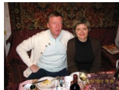
Чубайс на фоне ковра и новой жены