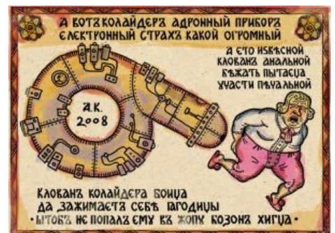
Анальный клован такой анальный