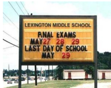
Анальные экзамены в пиндосской школе

Анальная мощь! (Anal Power, AP) (спойлер: у пингинов (как и у всех птиц) нет ануса, у них клоака)