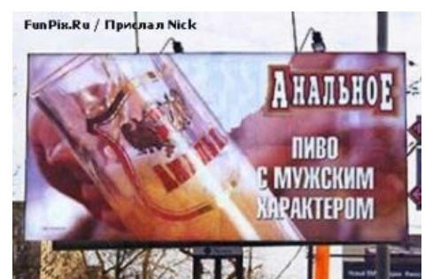
Пиво с мужским характером