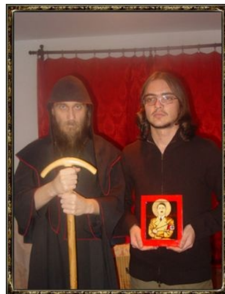
И Адольф — пророк его

В 2016 вампиры дотянулись до архиепископа откуда их никто не ждал: суд признал буйного монаха банкротом (должен Сбербанку 106,3 млн рублей).