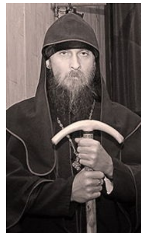
Амвросий с магическим посохом.