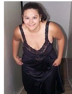
И Ад следует за ней

События и явления, описанные в этой статье, были давно, и помнит о них разве что пара-другая олдфагов. Но Анонимус не забывает!