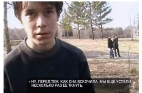
Вот эти ребята