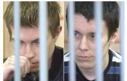
За джва года они состарились на 20 лет