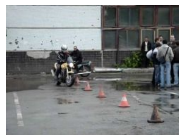
Сейчас возьмет и сдаст «змею» на площадке.

Тут все относительно просто и бесхитропно. Проверяют не только знание собственно ПДД, но и других инструкций, обязательных для каждого автолюбителя (положение по допуску транспортного средства к эксплуатации, законы РФ в части дорожного движения, приемы и способы безопасного вождения, основные элементы автомобиля, правила оказания первой помощи при ушибах, травмах и переломах). На 20 вопросов позволятся две ошибки, три ошибки — фейл. После нововведений, которые вступили в силу 1 сентября 2016 года, в случае ошибки тебе дают еще пять вопросов на ту же тему, ошибаться в которых уже нельзя. Общее количество ошибок все также не должно превышать двух. В Казахстане дается 40 минут на 40 вопросов, правильно ответить нужно минимум на 32 вопроса.