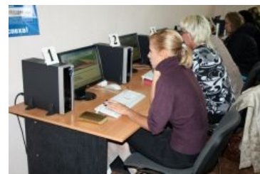
Они сдают «теорию».

В Казахстане же, наоборот, в 2016 году разрешили сдавать без окончания автошколы. Желающие даже могут предварительно пройти тест на ПДД и даже покататься, дабы изучить автодром и избежать факатов .