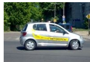
Обучение езде по пустой улице.

Типовой курс обучения — 3 месяца (в Казахстане — 4, включая 32 часа практики), в клинических случаях — 2 (на Украине встречаются и одномесячные, да) за счет сокращения курса, конечно же. Два «теоретических» занятия в неделю, где-то через месяц-полтора начинается «практика»... Теоретически. На деле — максимум через неделю: от монотонного чтения ПДД курсантам они не станут более подготовленными к началу своего «конца». Одно занятие формально должно длиться 2 «академических» часа (1,5 «астрономических»), IRL же занятия могут и до часа не дотягивать.