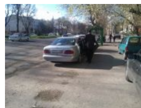
Казахский номер из Ташкента