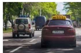
...и номера ДНР,