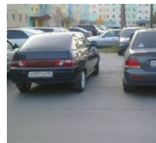
Х-УЕ С-ОС сургутский