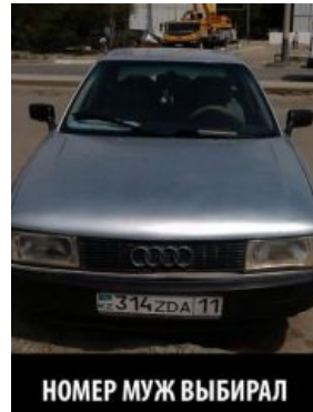
Номер образца 2012-го года