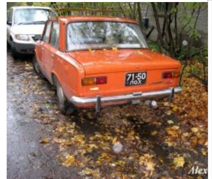
Стандарт 1958 года

Шло время, количество автомобилей росло очень быстро, и вдруг оказалось, что номеров не хватает. Масла в огонь подливало и решение оставить на номерах всего 12 букв (в Совке изначально было 28, после упразднения «Щ» — 27), имеющих аналоги латинских, дабы любой забулганый коллега ДПСников не утруждал себя знанием кириллицы. В 2004—2005 годах разрабатывали новые номера с чипами и шрифтом на манер немецкого, но на это всё вскоре забили, поняв что никому это на хуй не вперлось, да и геморно выйдет: