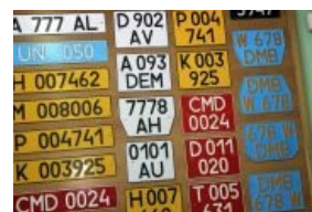
Старые образцы без флага

Размеры таблички отличаются от европейских стандартом 6 на 12 дюймов, чуть выше и чуть короче. Каждый штат имеет свой собственный вид номеров (причём меняя его раз в несколько лет). Кроме того, на американском номере указывается год(а сейчас ещё и месяц) регистрации, причём до 80-х год выбивался рельефом на знаке, сейчас же тупо наклейка. В США и Канаде именные номера допустимы и достаточно распространены. В некоторых штатах США