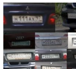
Х-УЕ С-ОС МОСКОВСКИЙ