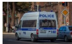
Номера Карабахской республики

Такие номера, как правило, отдаются различным чиновникам и их друзьям/родственникам/любовницам. Существуют и так называемые «ведомственные» серии — под служебные автомобили госорганизаций. Например, серия А-АА138 по частям была роздана следователям, приставам, прокурорам, МВД, мэрии Иркутска и областному правительству. А на серии А-МР97, помимо власти имущих, не прочь покатаются различные аллыпугачёвы и стасымихайловы . Бывали случаи, когда коробки с номерами вскрывались заранее, и из них предсудомительно вытаскивали номера от 001 до 010 и 111/222 и так далее. Так что, анонимус, не удивляйся, если автомобилист в очереди перед тобой получил номер 776, а тебе достался 778. Когда в Москве