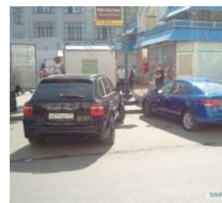
Х-УЕ С-ОС МОСКОВСКИЙ