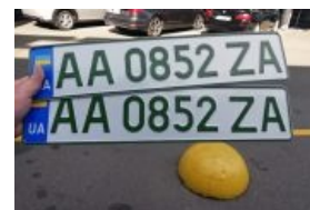
Номера для электромобилей