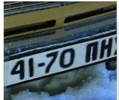
Олдовая классика из х/ф «Чародеи».