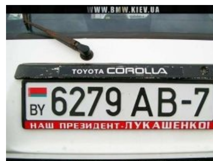
Наш Президент — Лукашенко!